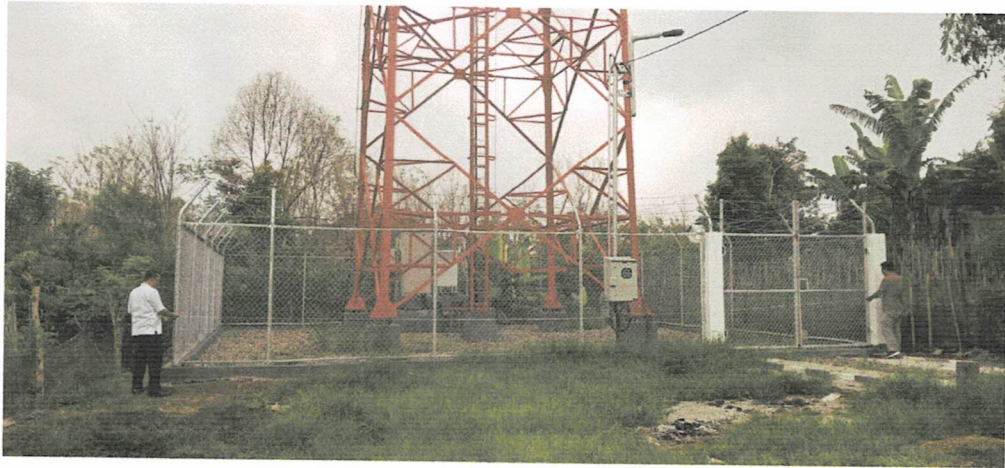
Tower - Padang Cahya Balik Bukit