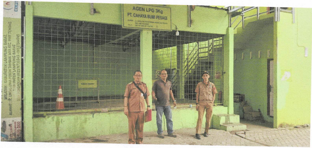
Gudang Gas LPG 3kg PT Cahaya Bumi Pesagi Way Tenong