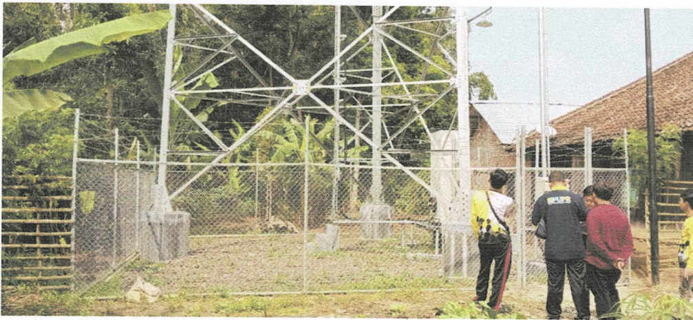
Tower - Hujung Belalau