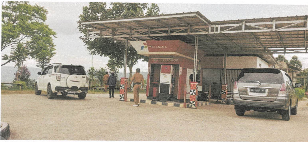
Pertashop Yuni Dalina Sumber Jaya