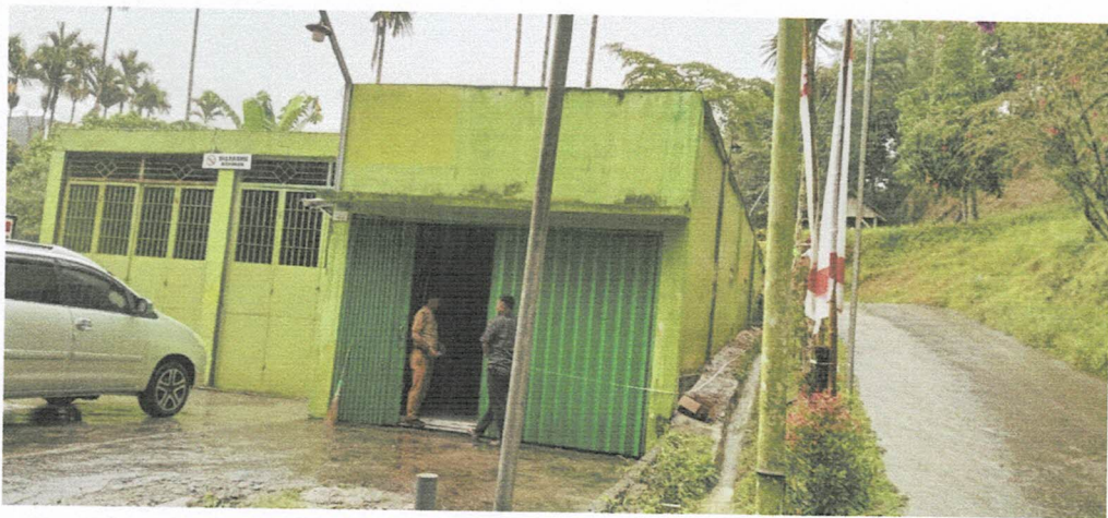
Gudang Gas LPG 3kg PT Desy Bersaudara Balik Bukit