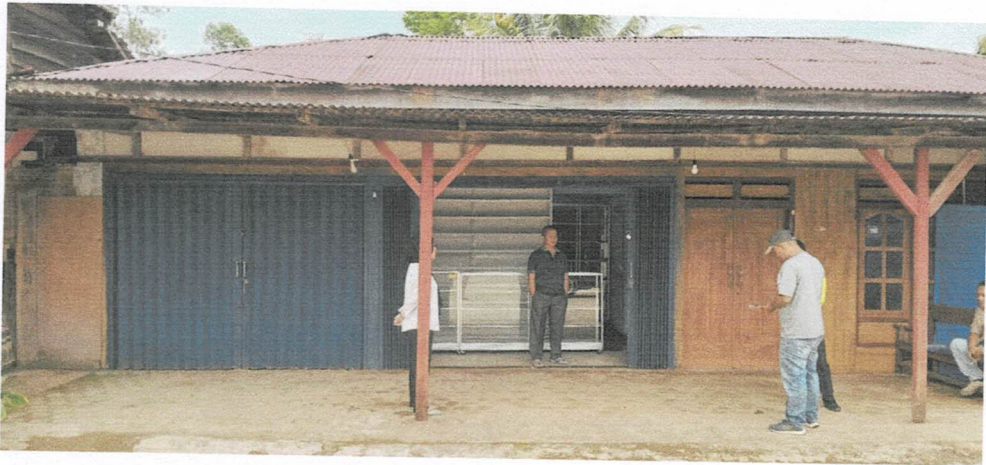
Apotek Zulfa Pagar Dewa