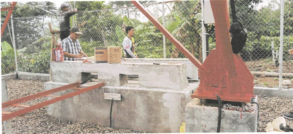
Tower - Tribudisukur Kebun Tebu