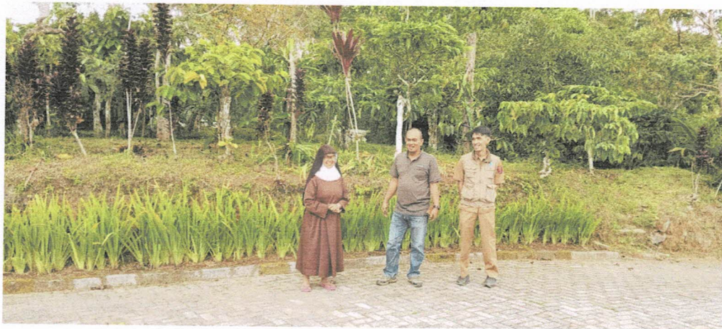
Guest House Paulina Sekincau