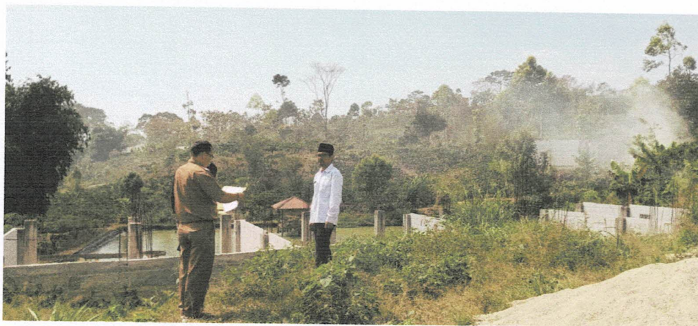
SMP IT Nurul Huda - Yayasan Masykuriyah Giham