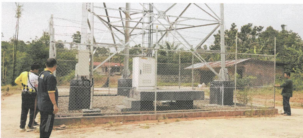
Tower - Mekarsari Pagar Dewa