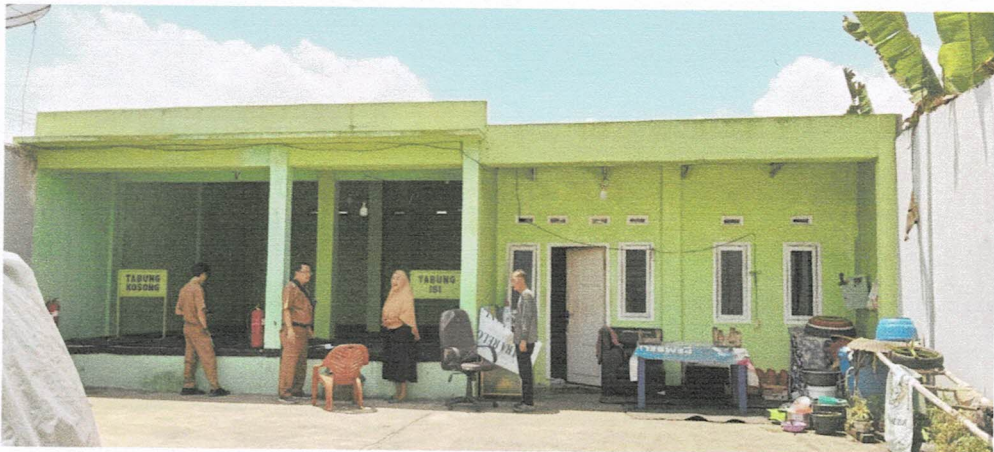
Gudang Gas LPG 3kg PT Rachmat Mulia Lestari Way Tenong