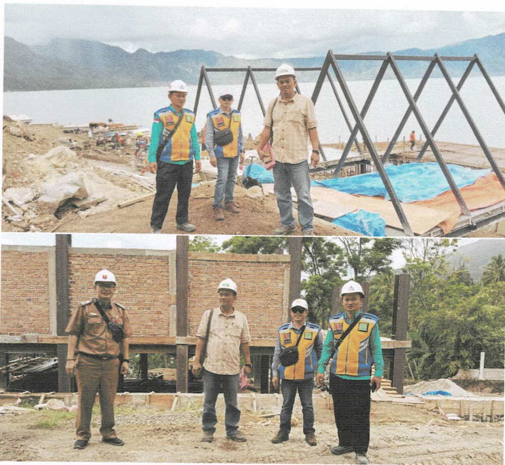
Pasar Tematik Dinas Kependag Lumbok Seminung