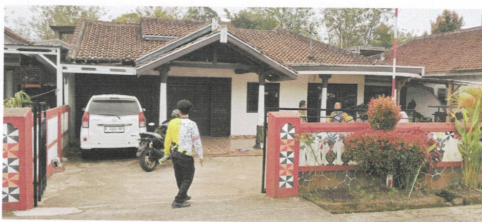
Sulaiman - Rumah Way Tenong