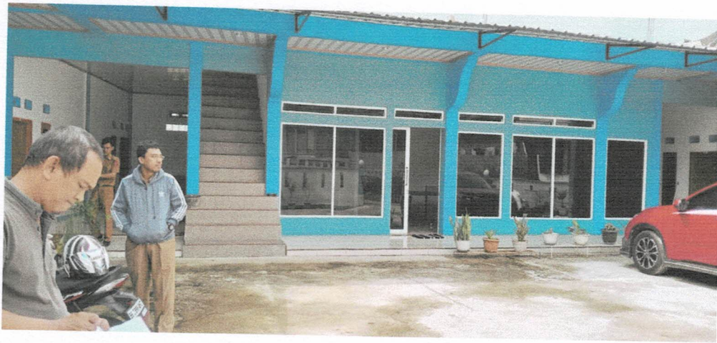
Hotel Samra Balik Bukit