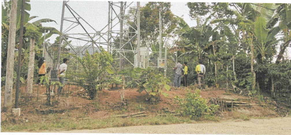
Tower - Air Dadapan Gedung Surian