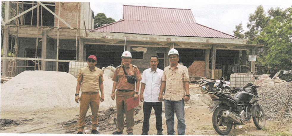
Sentra Olahan Ikan Dinas Industri Lumbok Seminung