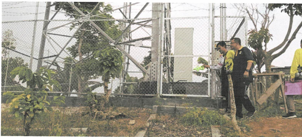
Tower - Pampangan Sekincau