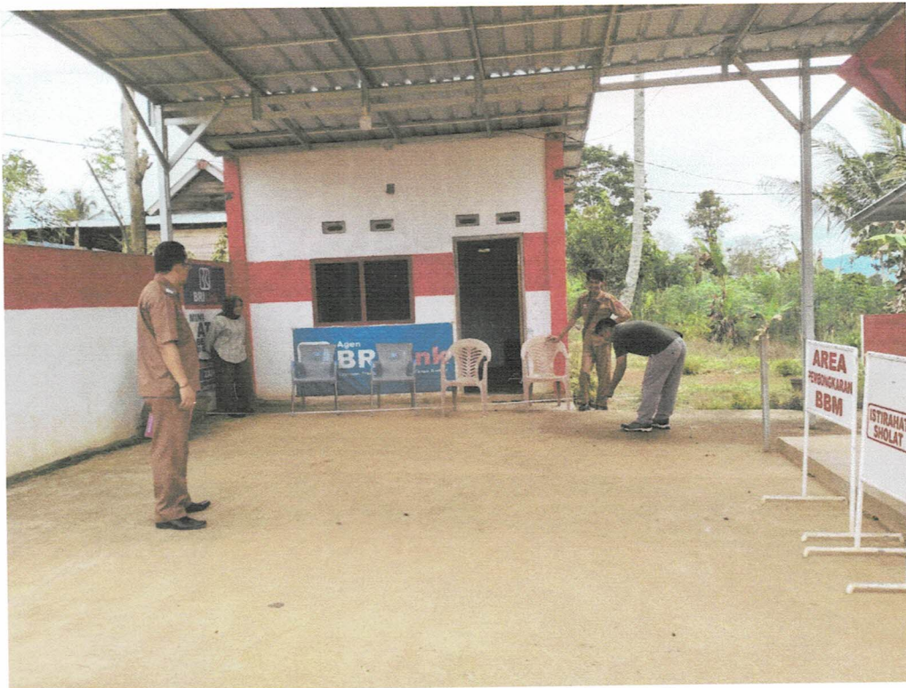
Pertashop Basungan Pagar Dewa