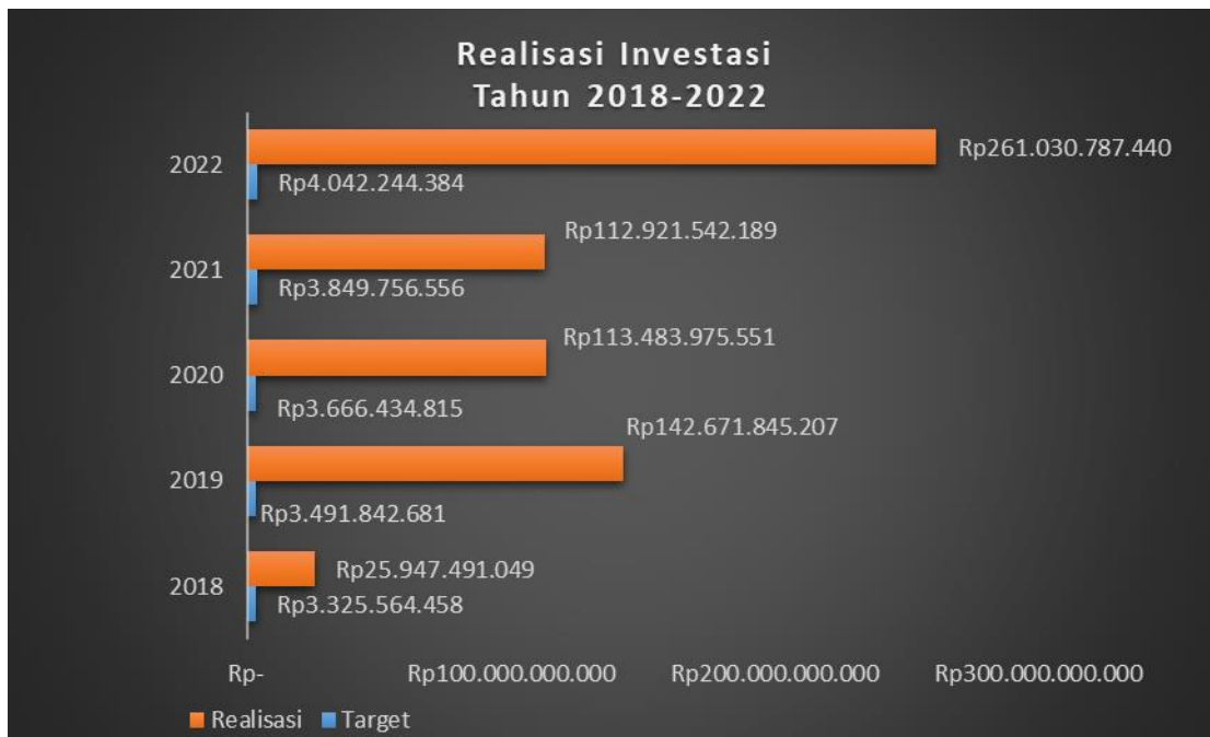
Tabel 1 Realisasi Investasi PMDN / PMA tahun 2018 s.d 2021 Kabupaten Lampung Barat

Capaian kinerja Dinas Penanaman Modal dan Pelayanan Terpadu Satu Pintu sebagai berikut :